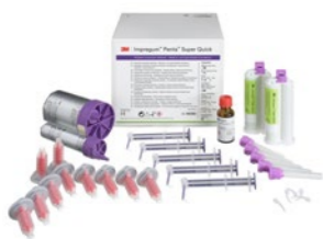
3M™ Impregum™ Penta™ Super Quick Medium/Light Body (69382), Uvodni komplet