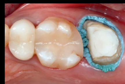
Učinkovita i brza kontrola vlažnosti i retrakcije gingivalnog tkiva uz astringentnu retrakcijsku pastu 3M™.

Materijal Impregum Super Quick može se snimiti skenerima najnovije generacije i tako omogućiti učinkovitiju suradnju s laboratorijem. Najbrži put do preciznosti u manje složenim slučajevima 3M™ Impregum™ Super Quick.