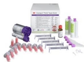
3M™ Impregum™ Penta™ Super Quick Heavy/Light Body (69416), Uvodni komplet