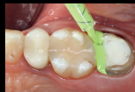
Praktična, vrlo precizna primjena polieterskoga otisnog materijala 3M™ Impregum™ Super Quick Light Body s pomoću ljubičaste intraoralne štrcaljke 3M™.