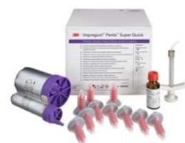
3M™ Impregum™ Penta™ Super Quick Medium Body (69384), Uvodni komplet